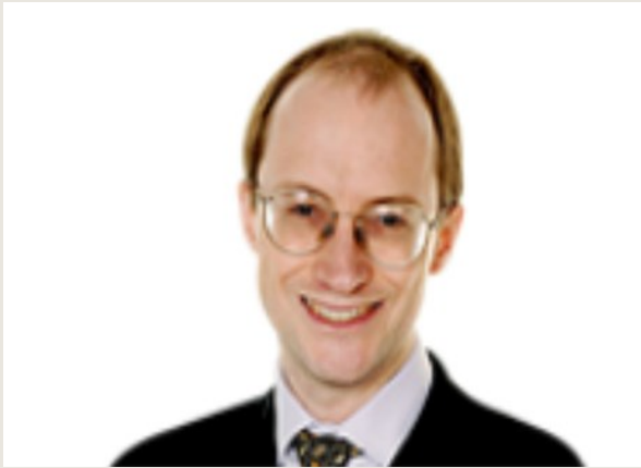
Tim Leunig: Cities Unlimited (2008)