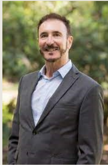
Michael Storper: Separate Worlds? Explaining the current wave of regional economic polarization (2018)