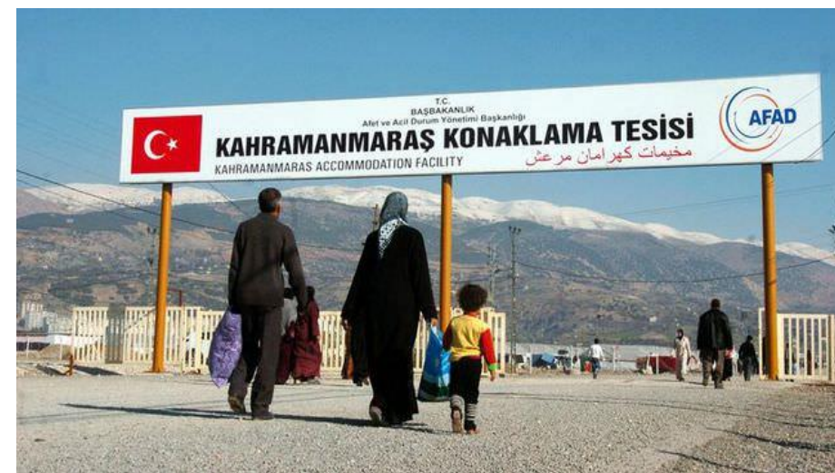
Daily Sabah, 2014.