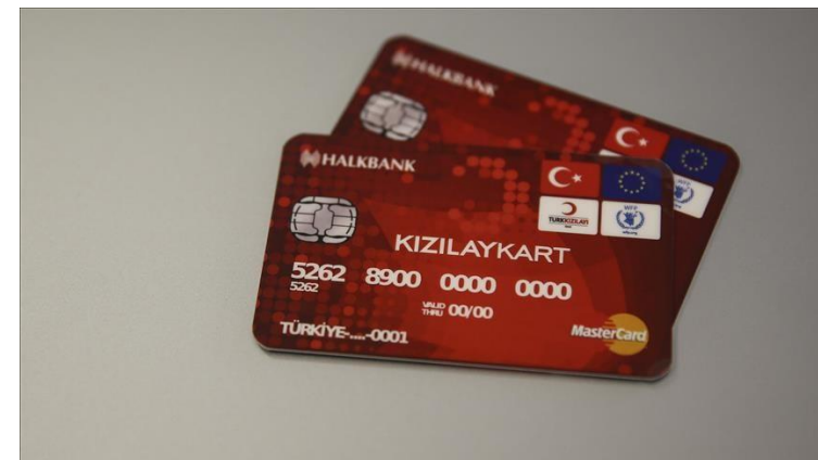
Middle East Monitor, 2018.