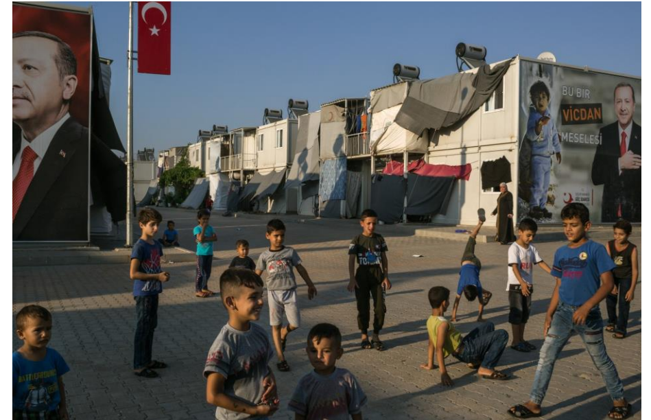
The New York Times, 2019.