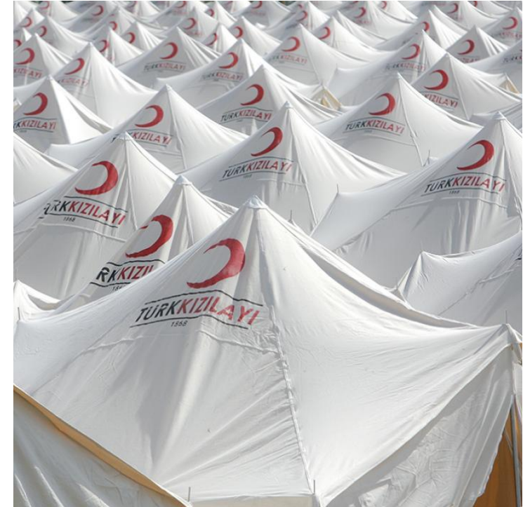
The Washington Institute for Near East Policy, 2018.