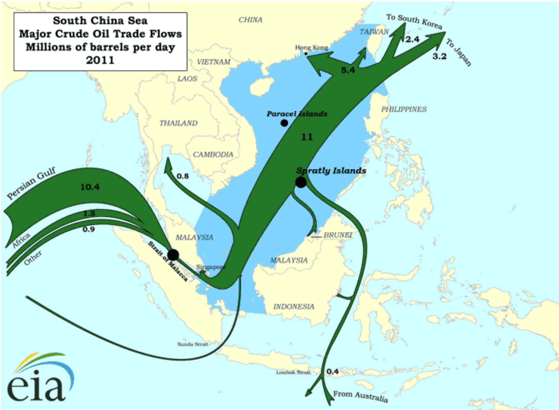
South China Sea Major Crude Oil Trade Flows Millions of barrels per day 2011