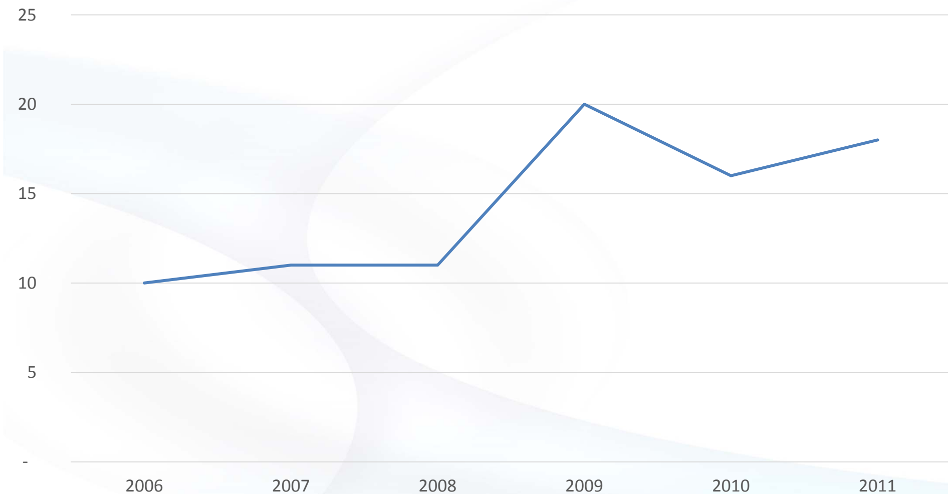
Településgazdasági Súly (helyezés)